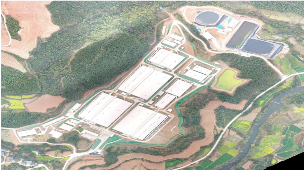
图 2 桥楼养殖场