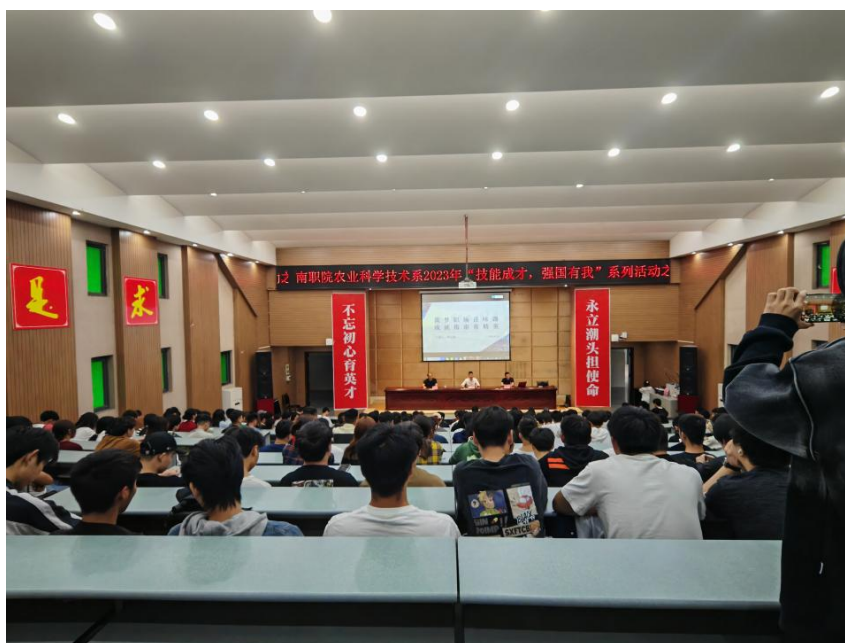
图5 工匠大师进校园

生自己独立思考，并写好，交由辅导员存档，并以此方向作为重点培养，毕业后给学生再次分享。