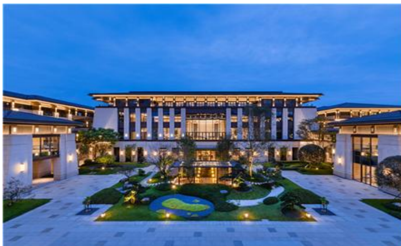
图1 合作单位盛美利亚酒店

西餐厅，游轮，以及西式连锁餐饮等；面点方向主要是面向各连锁糕点店的中央工厂，各大型酒店的面包房，以及大中型面包蛋糕房等。