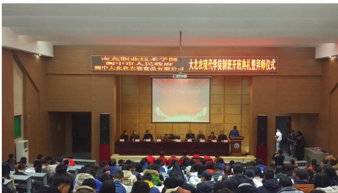
图 5 大北农现代学徒制班开班典礼暨拜师仪式（一）