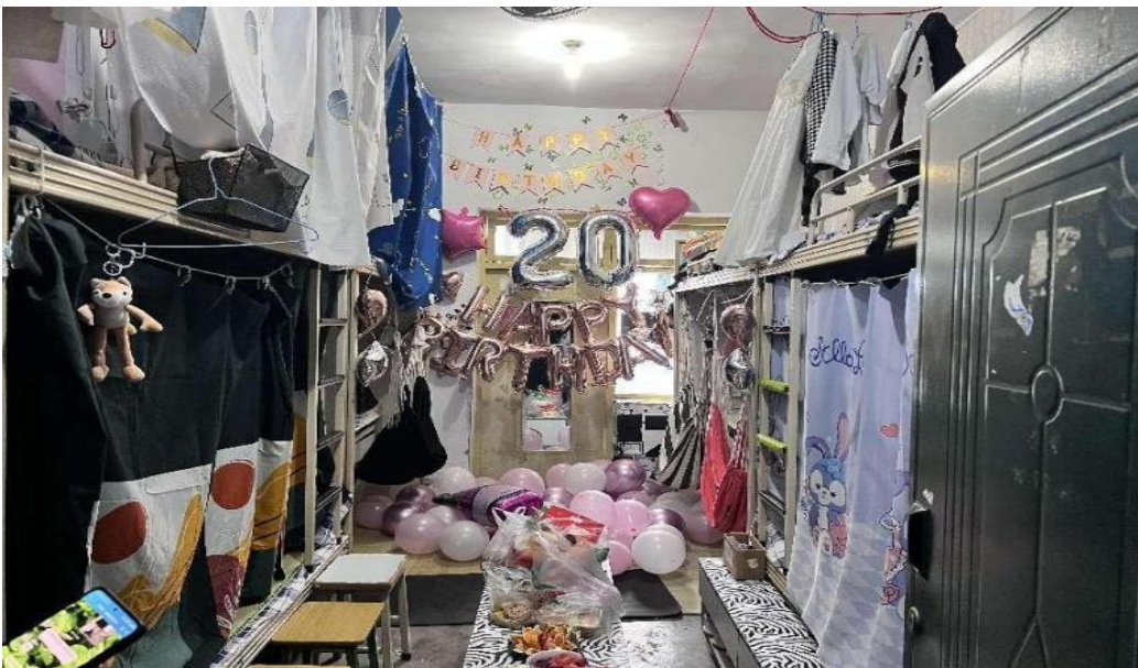
图 11 宿舍文化活动

落到实处：充分发挥班干部的作用，让学生去发动学生，充分调动学生的积极性。班主任需要每周走访学生寝室至少一次，了解学生生活情况和学习情况，找出问题学生并及时解决。定期参加系部主持的学生工作例会，从管理上形成一条线，以保证能够及时反馈和接受学生管理和教学方面的问题和任务，确保学生日常安全，教学正常运行。建立家校联系，定期与家长沟通，反馈学生在校情况，共育学生。