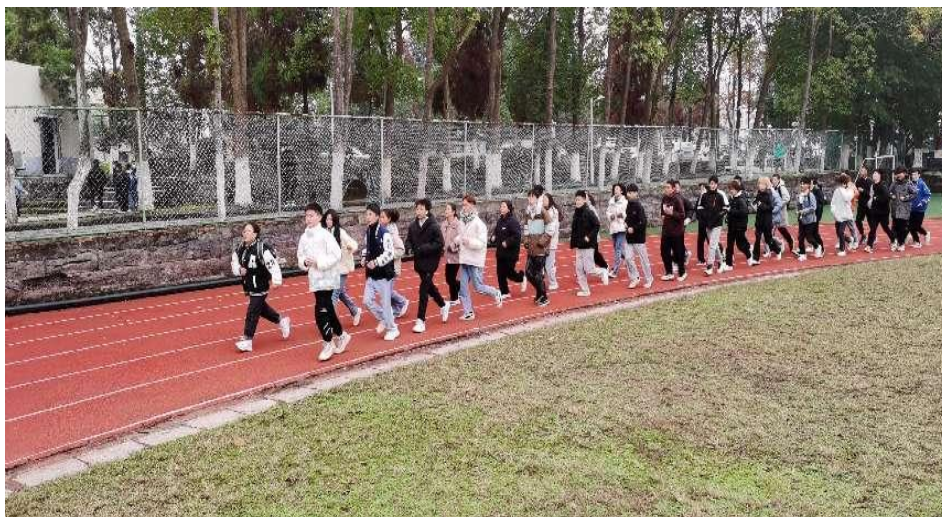
图 4 学生早操

思维方面：（1）每节实训课，总结学习心得以及当日所学内容，剖析操作流程，思考当日心得体会，并发散思维。每周老师检查（2）定期学生谈心，了解学生近况及思想情况，同时引导学生思想。（3）安全教育，每周安全班会，学生自己组织，并讨论，辅导员监督。每月专业安全教育课，由安全负责老师，组织统一上课。（4）工匠大师进校园，每季度不定期聘请行业、本科院校、科研机构等单位权威人士、工匠大师，根据学生不同学习阶段，进行不同内容的讲座，让学生学习了解更多行业现状的同时，确定目标及方向。（5）法律意识讲座，加强学生思想教育，提高学生自我保护能力，每学期安排法律顾问为专业学生进行法律知识科普。（6）感恩教育，每期期末进行感恩主题班会，让学生心怀感恩，并布置感恩作业，对家人、朋友的感恩行动。（7）每期开学，对本学期进行规划，第二学年进行人生规划，学