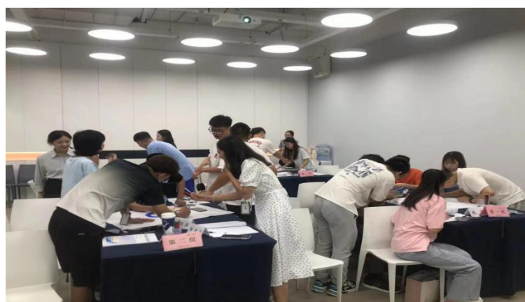
图2 2020 学生分组讨论管理思路

以班级为单位模拟大型酒店厨房的组织架构，设置行政总厨（《中式烹调工艺》老师担任）、运营保障部总监、产品研发部总监、市场营销部总监等公司核心管理岗位；以此来培养学生管理与自我管理的能力。公司以行政总厨为核心，各部门进行明确分工和考核，培养学生自我管理能力的同时，明确将来发展方向，实现与行业“0距离”对接。