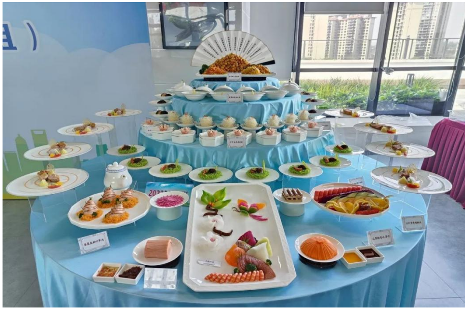
图3 学生宴席设计作品