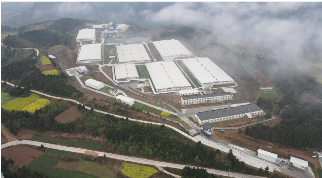
图 3 河楼养殖场