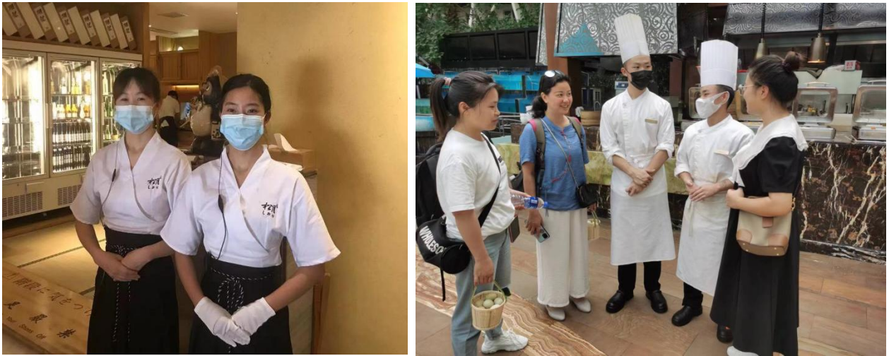
图 13 老师去实习单位看望学生