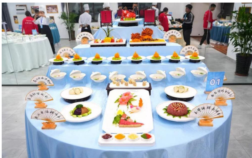
图 15 省赛宴席展示