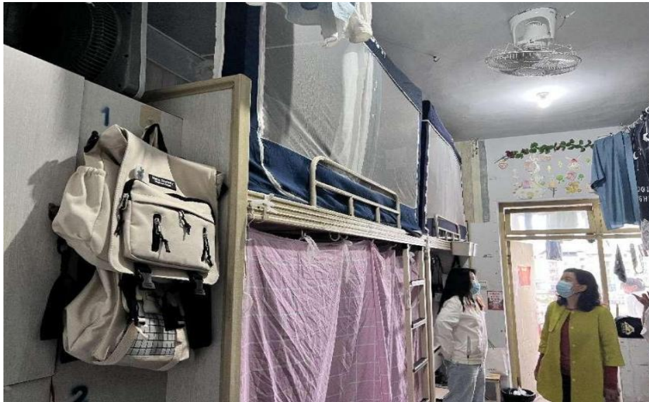
图 12 辅导员日常查寝