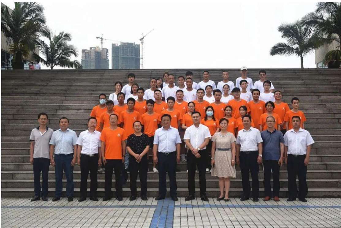
图 7 学校相关负责人领导、老师，大北农学徒制班的校企辅导员、导师合影