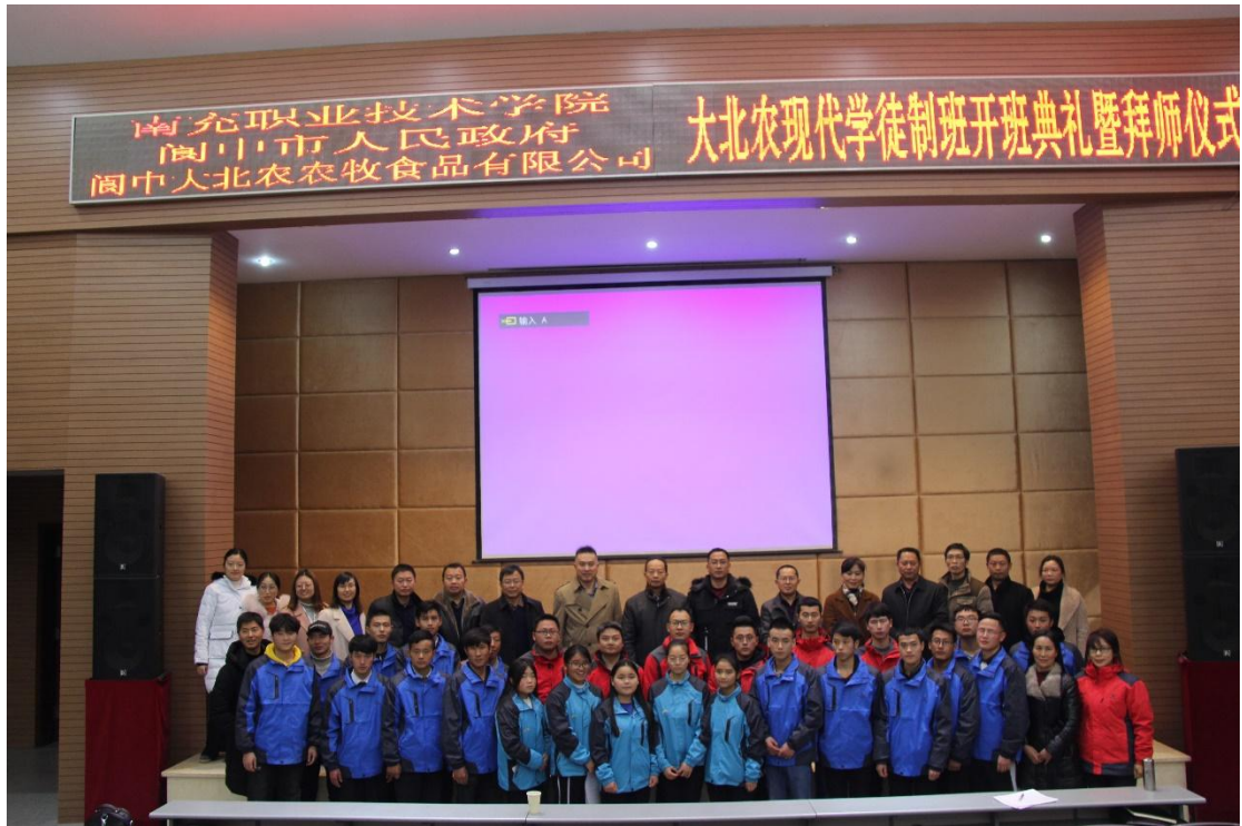
图 6 大北农现代学徒制班开班典礼暨拜师仪式（二）