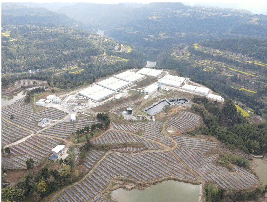
图 4 老观养殖场