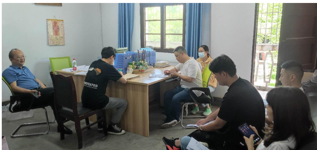
交流现场

任书记首先对我系现阶段教学诊改任务做了说明介绍，强调了课程建设对下一步诊改工作的重要性。