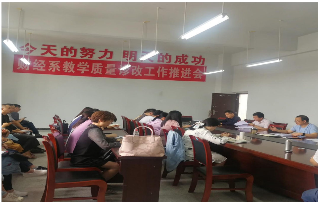
会议现场