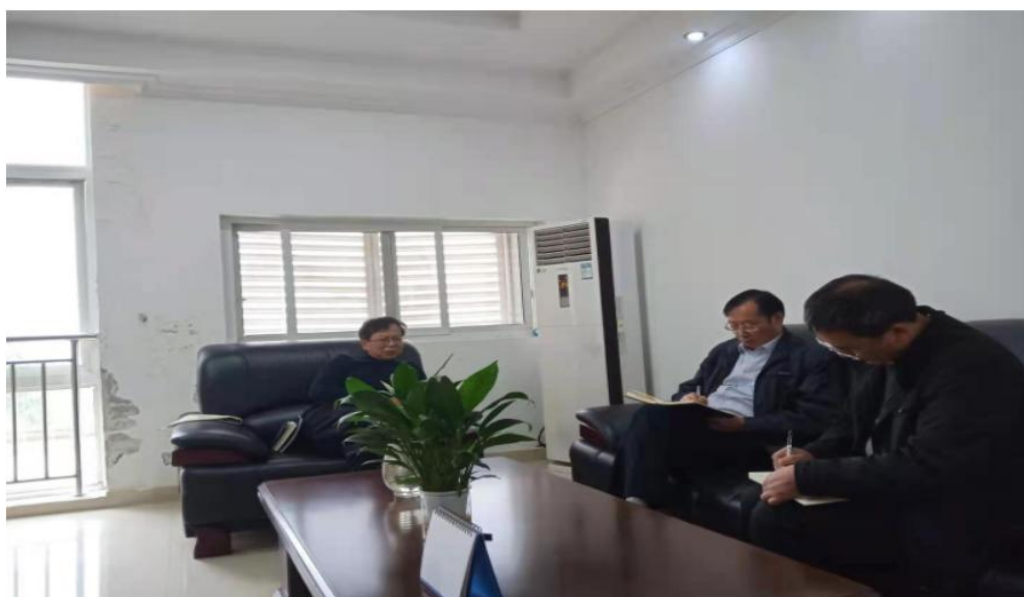
交流会现场